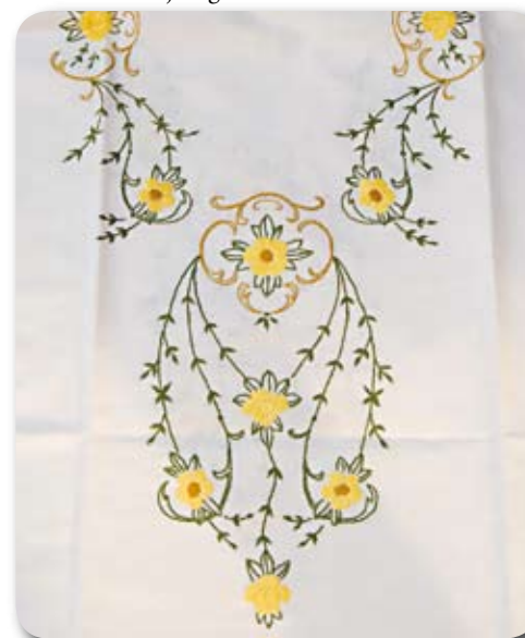
Duk till försäljningarna