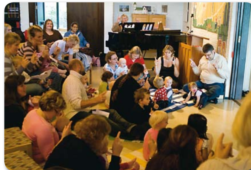
Vardagsgudstjänst i Församlingscentrum