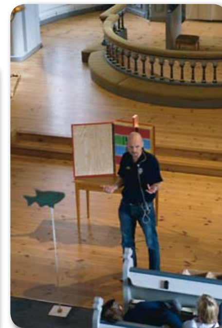
Vandring genom gamla testamentet med konfirmanderna